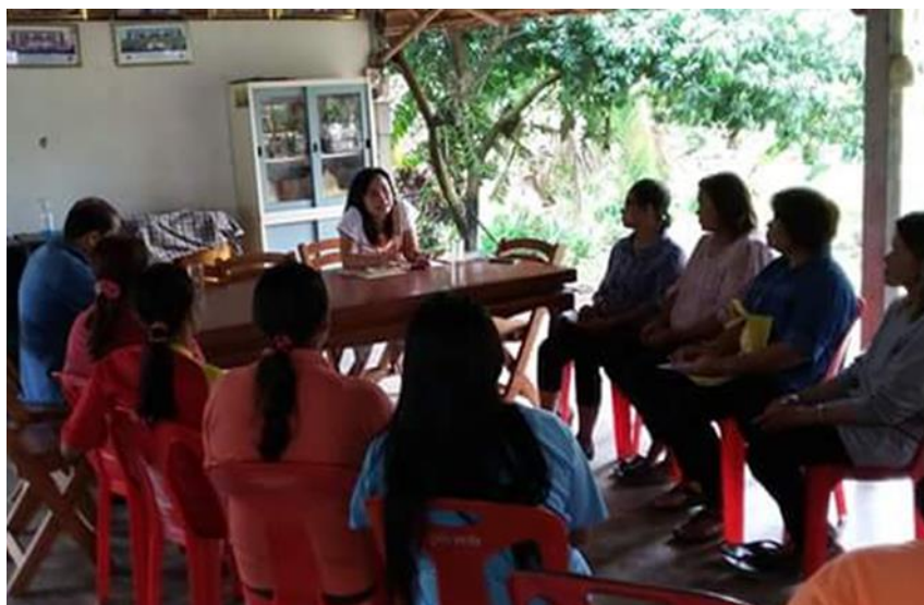
ภาพ 2 การศึกษาดูงาน ณ มูลนิธิเกษตรกรรมยั่งยืน (ประเทศไทย) ตำบลแม่ทา อำเภอแม่ออน จังหวัดเชียงใหม่